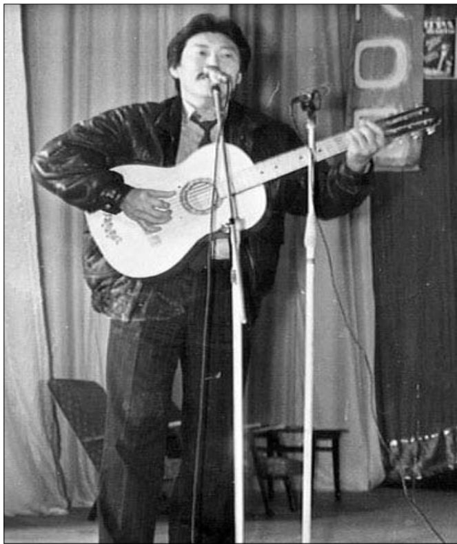
(Окончание. Начало на 1 стр.)

В России не редки случаи ДТП, виновниками которых являются сотрудники правоохранительных органов. Средства массовой информации широко освещают эту тему, однако подобных происшествий не становится меньше. Возможно, лицо, обладающее заветной "корочкой", считает, что ему позволено больше, чем рядовому человеку, и теряет чувство ответственности за свои действия. Но практика показывает: за подобную беспечность слишком велика расплата – как правило, это чья-то человеческая жизнь, исковерканные судьбы родственников.