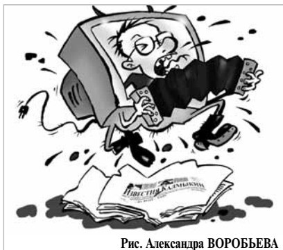
Рис. Александра ВОРОБЬЕВА

В последнее время жители Калмыкии практически ежедневно наблюдают, как местные СМИ — газеты и телевидение — поливают грязью республиканское МВД и его руководителя, министра Журавлева. Каковы причины развязанной травли?